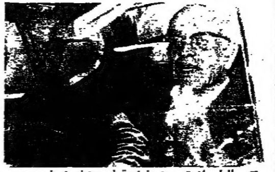
الرئيس سرّيس مع وفد الجبهة اللبنانية في بيروت

كلمة « كان لقاء الرئيس سرّيس وأركان الجبهة اللبنانية أمس في بيروت، وبعثت رسالة واضحة حول موقف الجبهة اللبنانية من عملية التفاوض، وهي «نحن نؤمن بأننا لن نتنازل عن مبادئنا الأساسية، ولا نريد أن نكون طرفاً في أي عملية تقاسم السلطة، ونحن نؤمن بأننا لن نتنازل عن حقوقنا، ولا نريد أن نكون طرفاً في أي عملية تقاسم السلطة. »